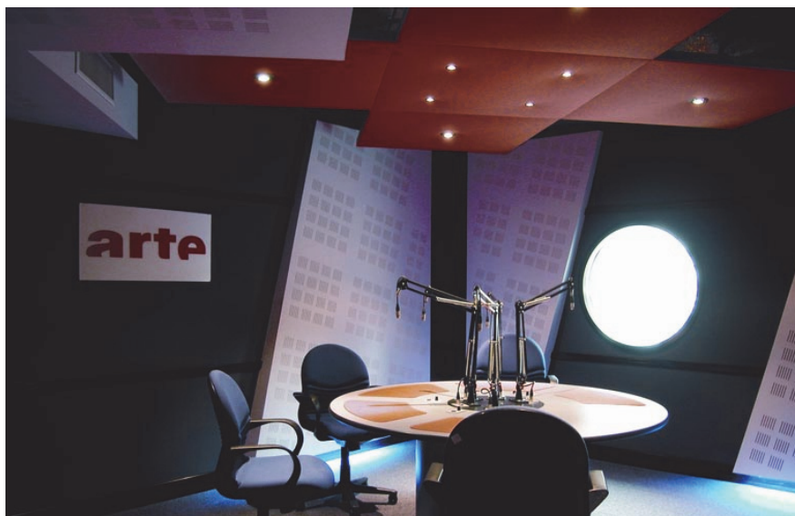
Controsoffitto a pannelli fonoassorbenti, con elementi in gesso fessurato e retroilluminato alle pareti, sullo sfondo di un rivestimento murale in tessuto e fibra di poliestere

Alle soluzioni specifiche per ambienti in cui occorre l'uso di vari prodotti, in grado di operare in modo selettivo su determinati suoni, come nel caso di sale per concerto o studi di registrazione