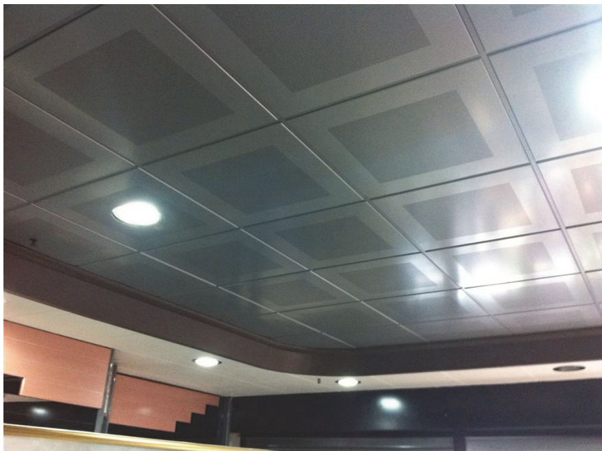
Controsoffitto in lamiera microforata con tessuto fonoassorbente all'interno

Dalle soluzioni comuni, legate all'uso di prodotti modulari che coniugano buone caratteristiche acustiche alla praticità di impiego, dove predomina l'aspetto funzionale legato all'ispezionabilità delle intercapedini